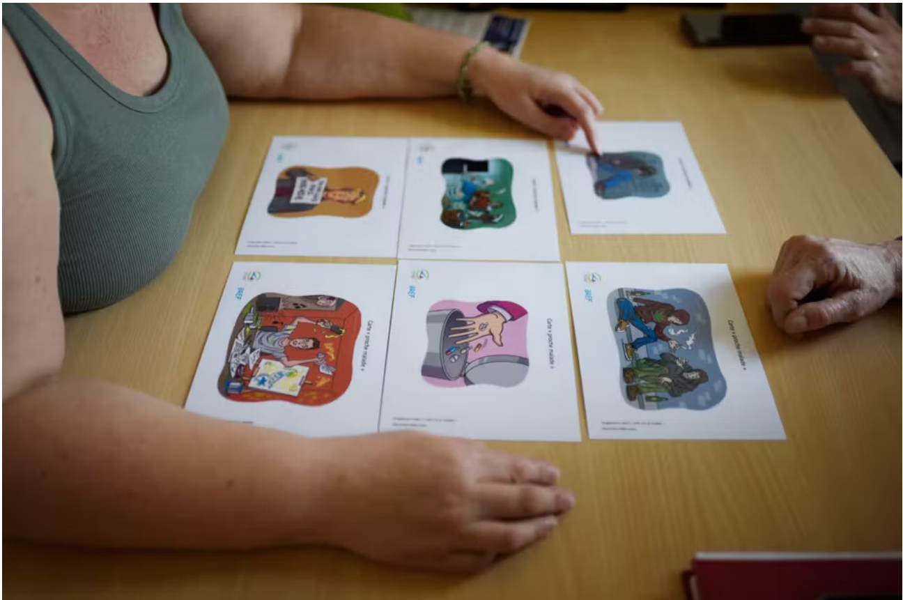
Des cartes visuelles sont utilisées pour décrire les comportements d'un proche atteint d'un trouble psychique ou addictif lors d'un rendez-vous entre une mère aidante, une paire-aidante et un infirmier de liaison dans le cadre du programme BREF, au GHU Paris, le 19 mars 2026.